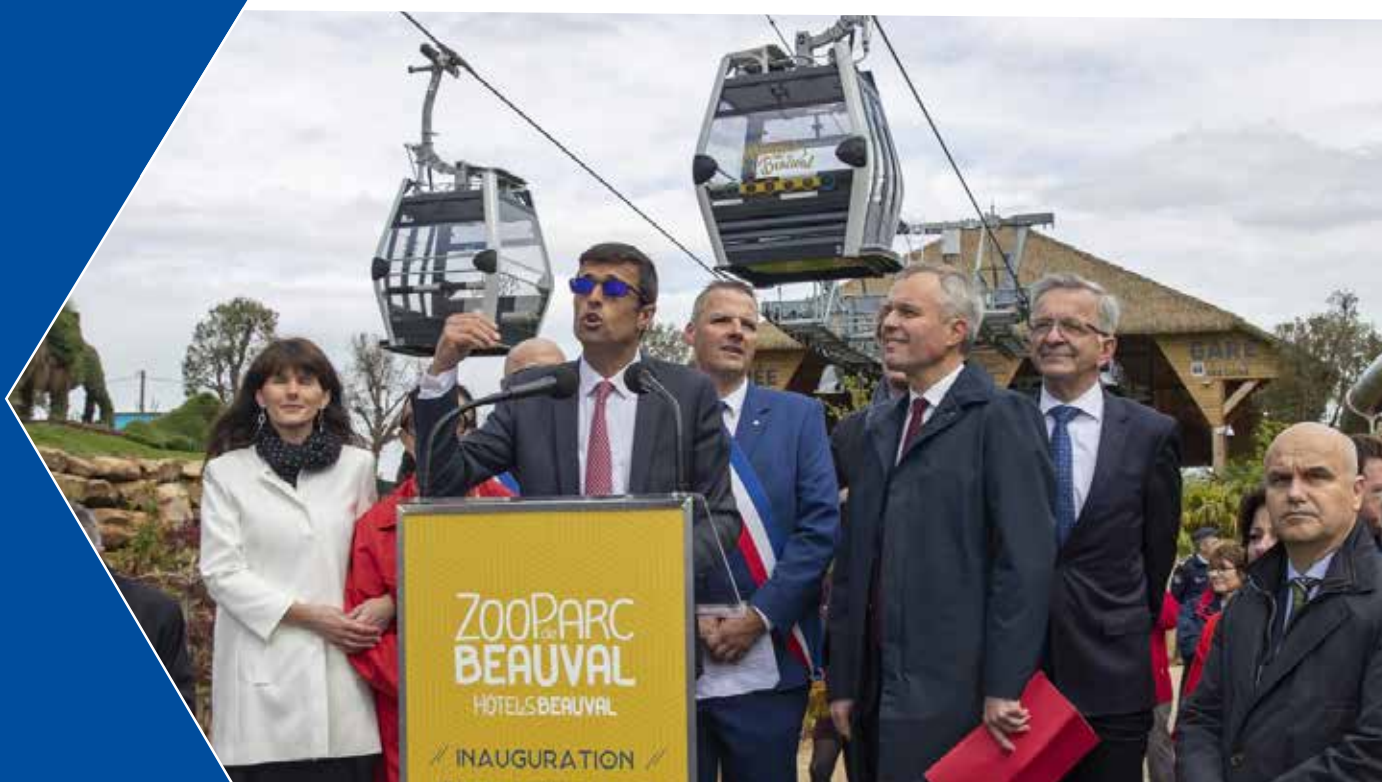
Inauguration télécabine POMA©ZooParc de Beauval

Ce jeudi 25 avril, M. de Rugy, Ministre de la Transition écologique et solidaire a officiellement inauguré « Le Nuage de Beauval », une télécabine aussi unique en France que le zoo qui l'abrite.