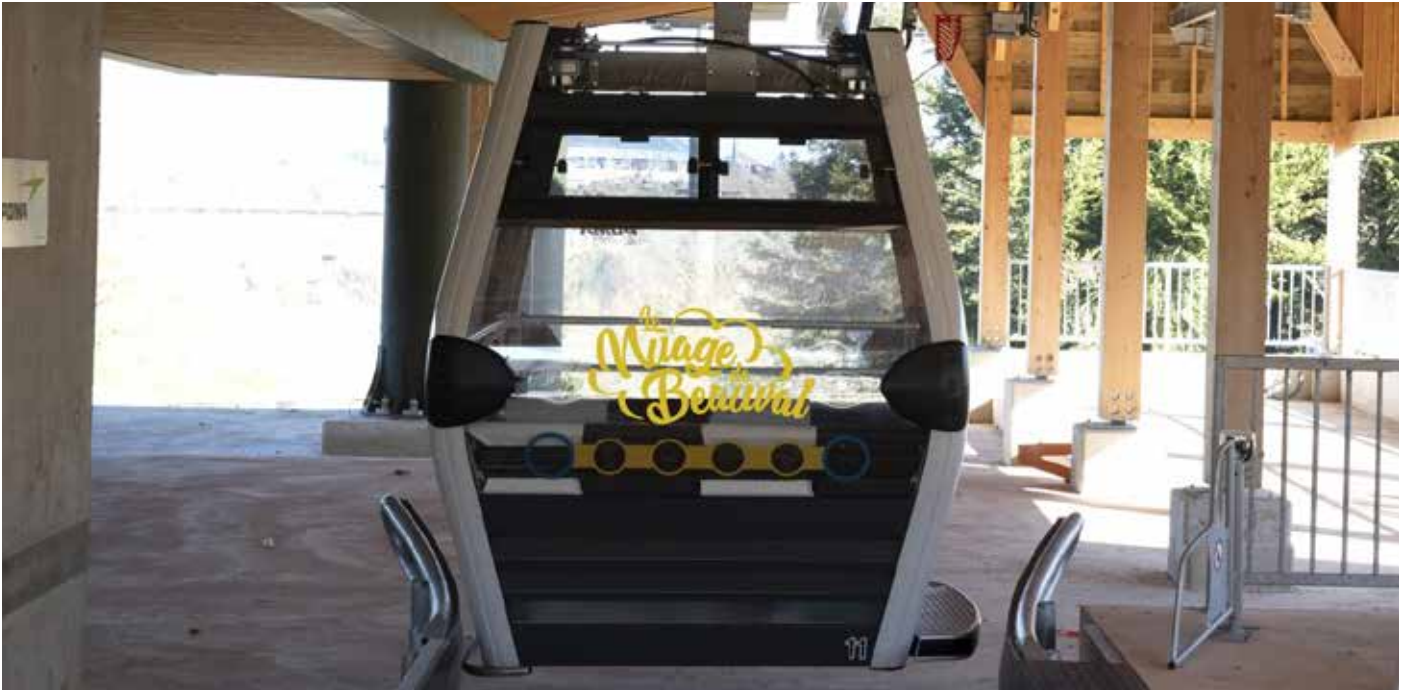
Télécabine POMA

► La fabuleuse télécabine « Le Nuage de Beauval » a embarqué ses premiers passagers samedi 30 mars à 10h pour un voyage inédit en France, au cœur de l'un des quatre plus beaux zoos du monde. Depuis, les visiteurs se pressent en nombre pour le découvrir. Accueillant chaque année plus de 1,5 million de visiteurs, le ZooParc de Beauval prend soin