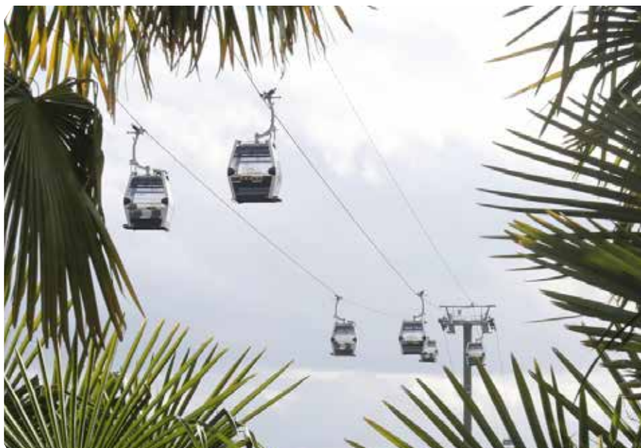
Télécabine POMA@ZooParc de Beauval