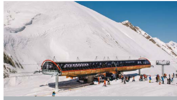
ТС10 — ГРУЗИЯ — ГУДАУРИ