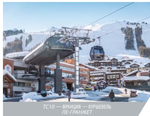
ТС10 — ФРАНЦИЯ — КУРШЕВЕЛЬ ЛЕ-ГРАНЖЕТ