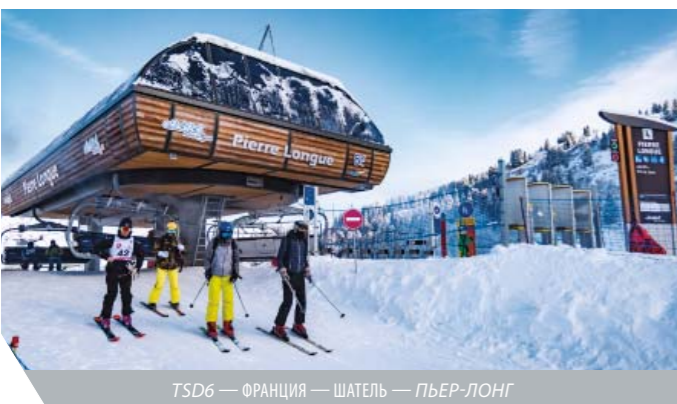
ТSD6 — ФРАНЦИЯ — ШАТЕЛЬ — ПЬЕР-ЛОНГ