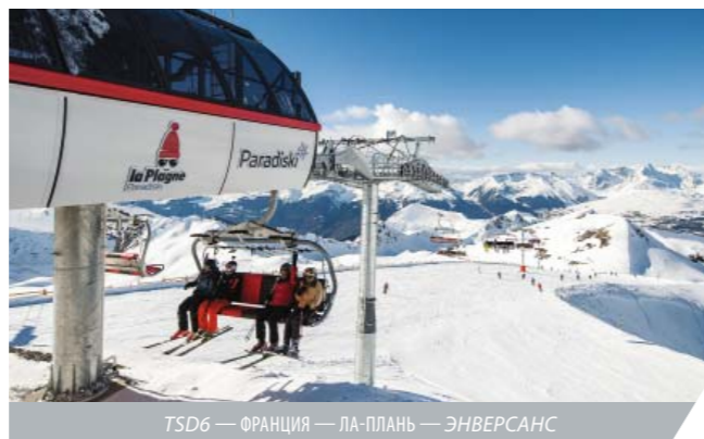
ТSD6 — ФРАНЦИЯ — ЛА-ПЛАНЬ — ЭНВЕРСАНС