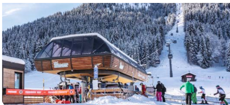
ТС10 — ШВЕЙЦАРИЯ — ЛЕ-ДЬЯБЛЕРЕ — ДЬЯБЛЕРЕ-ЭКСПРЕСС