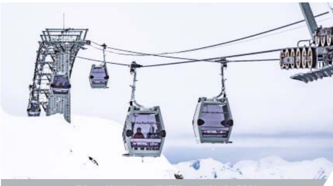
ТС8 — ФРАНЦИЯ — МЕРИБЕЛЬ — МОН-ВАЛЛОН