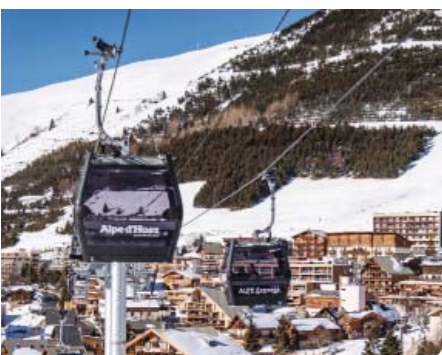
ТСSP10 — ФРАНЦИЯ — АЛЬП-Д'ЮЭЗ АЛЬП-ЭКСПРЕСС