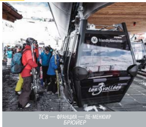
ТС8 — ФРАНЦИЯ — ЛЕ-МЕНЮИР БРЮЙЕР