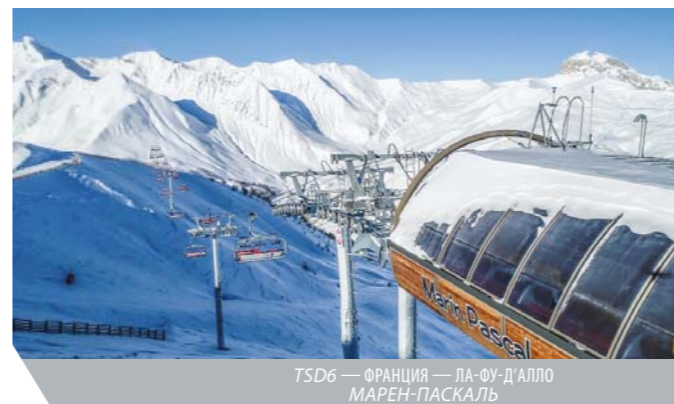
ТSD6 — ФРАНЦИЯ — ЛА-ФУ-Д'АЛЛО МАРЕН-ПАСКАЛЬ