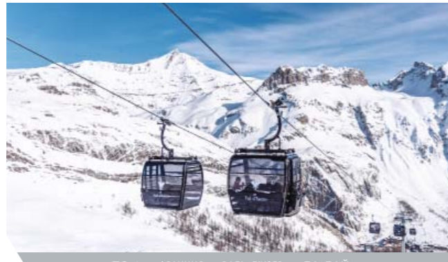
ТС10 — ФРАНЦИЯ — ВАЛЬ-ДИЗЕР — ЛА-ДАЙ