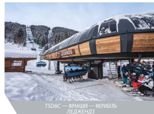
ТSD6С — ФРАНЦИЯ — МЕРИБЕЛЬ ЛЕДЖЕНДЗ