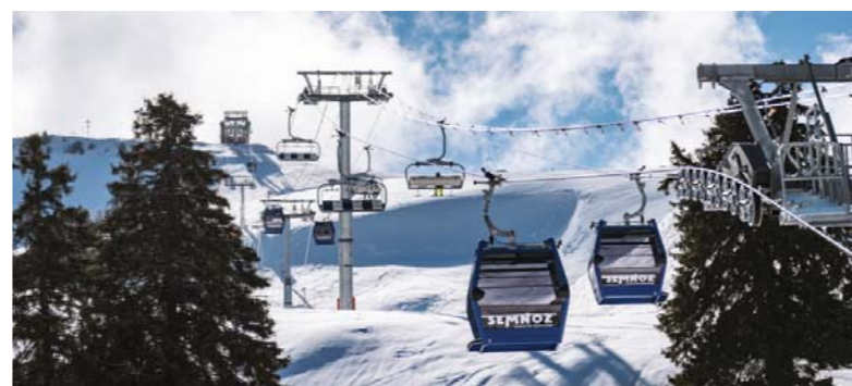
ТМХ6/10 — ФРАНЦИЯ — ЛЕ-СЕМНОЗ ЛЕ-БЕЛЬВЕДЕР