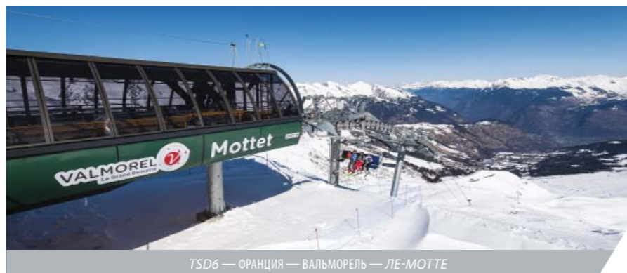
ТSD6 — ФРАНЦИЯ — ВАЛЬМОРЕЛЬ — ЛЕ-МОТТЕ