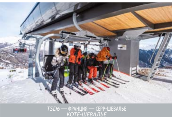
ТSD6 — ФРАНЦИЯ — СЕРР-ШЕВАЛЬЕ КОТЕ-ШЕВАЛЬЕ