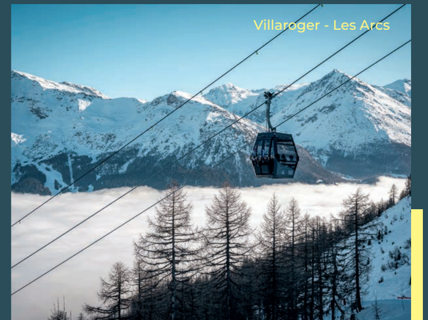
Villaroger - Les Arcs