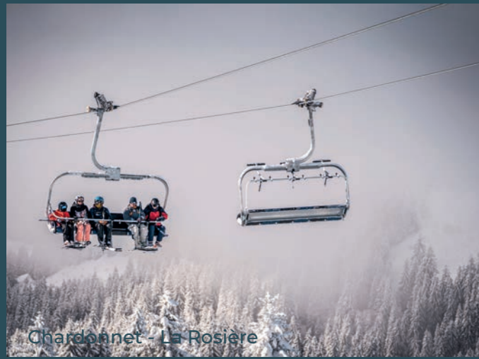
Chardonnay - La Rosière