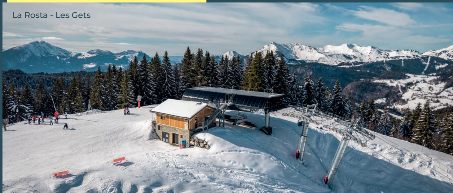
La Rosta - Les Gets