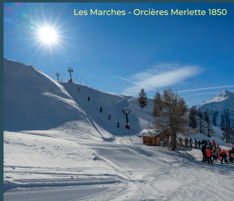
Les Marches - Orcières Merlette 1850