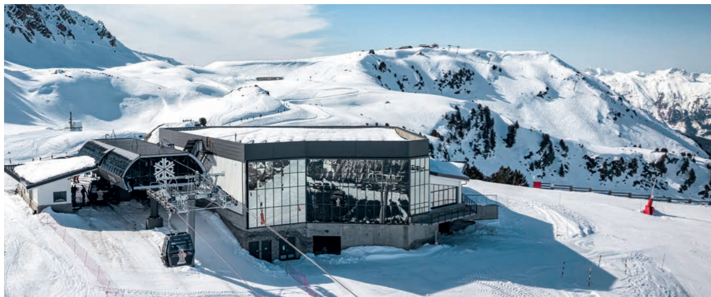
CHENUS - COURCHEVEL, France Télécabine 10 places

Sur tous les massifs français, des téléportés innovants stimulent le dynamisme des territoires tout au long de l'année grâce à des solutions durables, qui transforment le transport des passagers en expériences de pur plaisir.